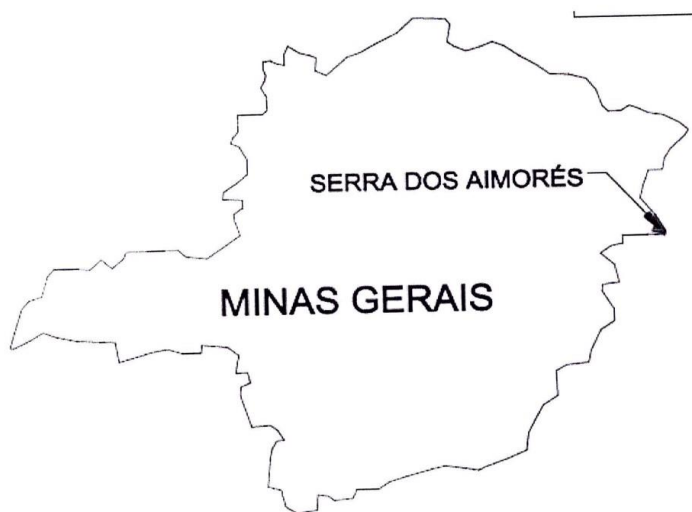
Imagem 1 – Localização do Município

Memorial Descritivo de obra de construção de quadra poliesportiva na Escola Municipal Jaime Gomes de Souza Lemos, localizada à Rua Rua Rio Paranaíba, número 140, Centro, na sede do Município de Serra dos Aimorés, no Estado de Minas Gerais, de propriedade do Município de Serra dos Aimorés, Pessoa Jurídica de Direito Público inscrito no CNPJ sob número 18.398.966/0001-94, com sede na Avenida Rio Amazonas, 700, Centro, Serra dos Aimorés – Minas Gerais.